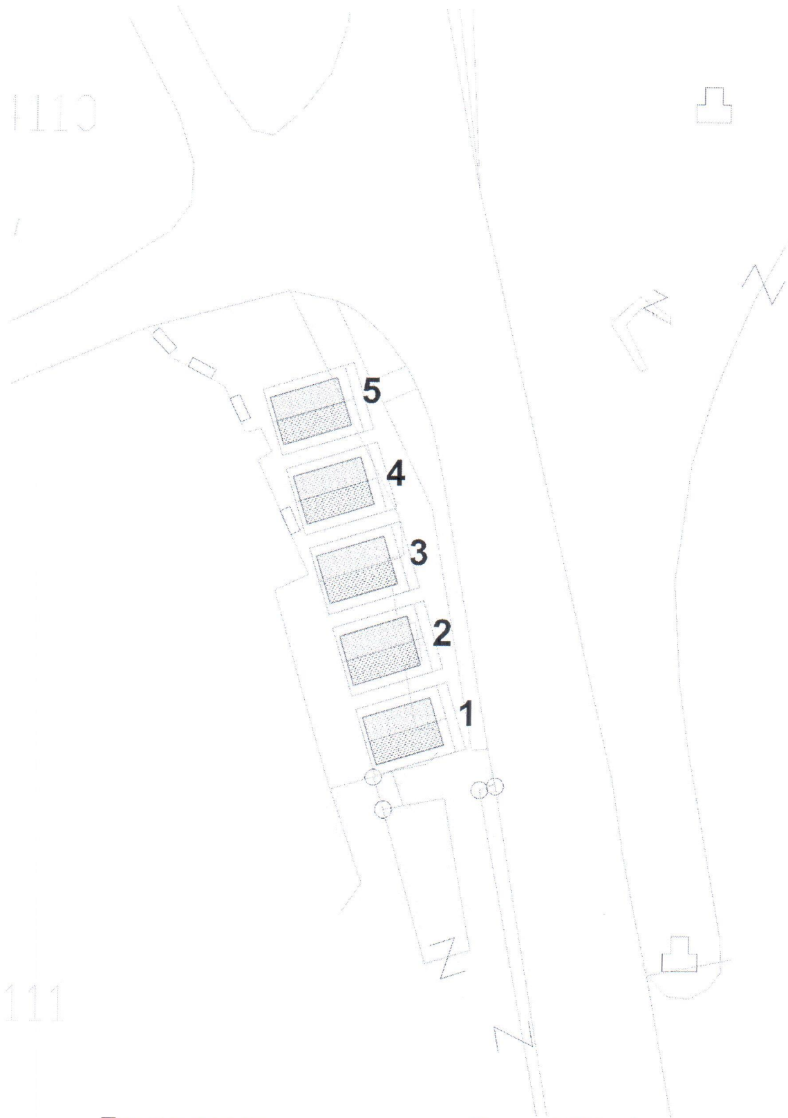
Приказ и нумерирање на киосци на м.в. Гумење, КП бр.4111/1