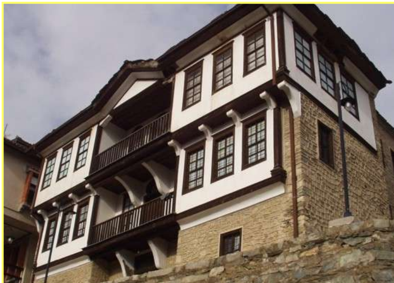
Галерија Никола Мартиноски

Покрај културно-историските споменици, градот изобилува и со стари куќи изградени со посебен архитектонски стил и затоа Крушево се нарекува и музеј на стара архитектура.